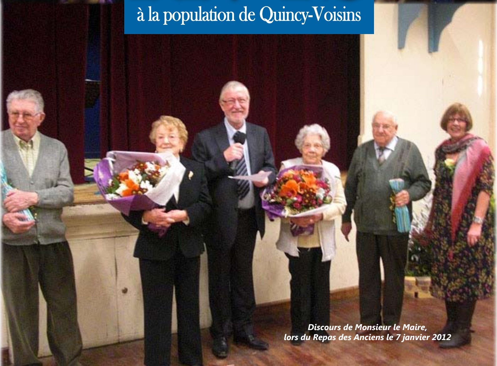
Discours de Monsieur le Maire, lors du Repas des Anciens le 7 janvier 2012